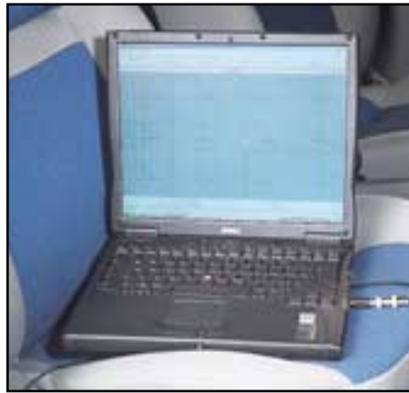
Ideale Kombination: Ein freier Beifahrersitz und „Praxis“ auf einem Notebook.

Eine Anlage abzustimmen heißt, ihre Schwächen (also die Welligkeiten im Frequenzgang) festzustellen und diese dann per Equalizer auszugleichen. Da dies aber nicht ganz einfach ist, erst einmal ein kleiner Exkurs in die Fahrzeugakustik. Eine unabgestimmte Auto-HiFi-Anlage weist fast immer typische und meist ganz ähnliche Probleme auf, die allesamt weniger von dem Charakter des Lautsprechersystems, sondern von den Einbaugegebenheiten im Fahrzeug abhängen.