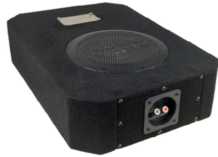
RO8 FLAT EVO DBR