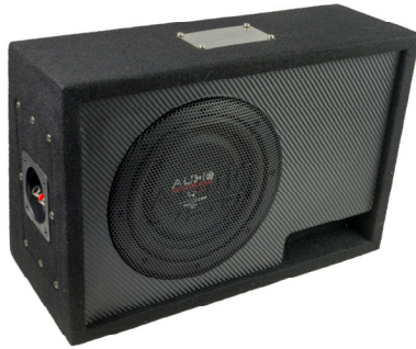
RO8 FLAT EVO BR