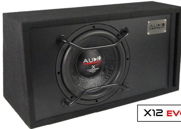
X12 EVO BR