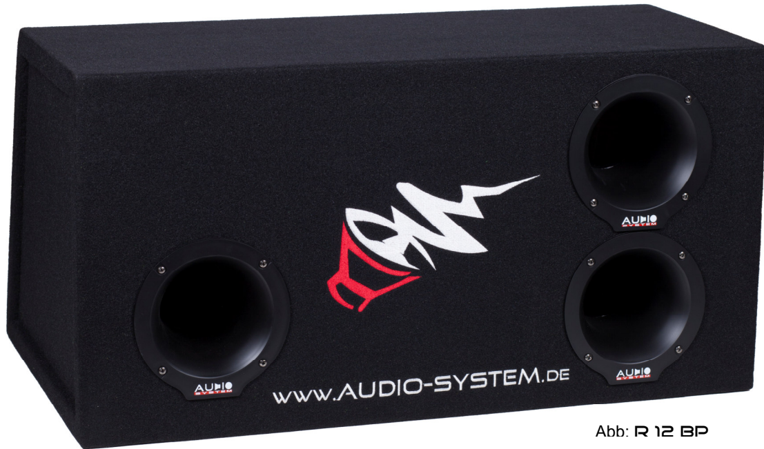
Abb: R 12 BP