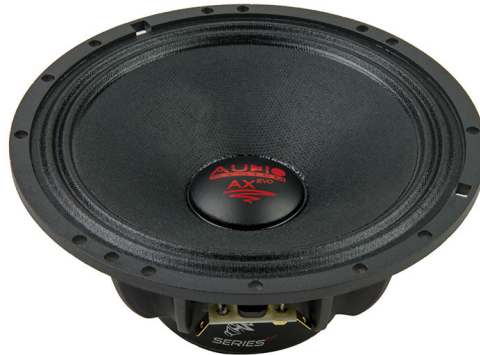
AX165 PA EVO