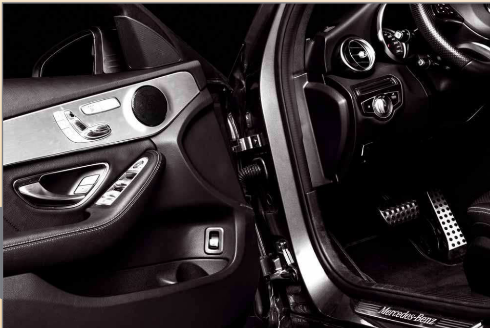
Die Einbauplätze sind akustisch günstig weit oben in den Türen