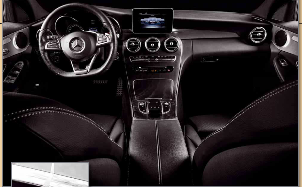
Die 20er Tieftöner sitzen unter dem Armaturenbrett