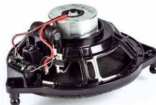
Auch der Center ist ein 10er-Koax

Vorkonfektionierte Weiche für einfachen Anschluss