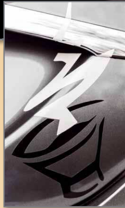
Der Platz für den Centerspeaker füllt ein Koax