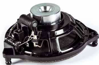
Der stabile Korb passt genau in den Originalplatz

zum Car-HiFi-Fachhändler zu fahren und zu sagen: „Verschaff mir bitte besseren Sound in meinem Benz.“ Doch viele Kunden schrecken aufgrund der finanziellen Hürde davor zurück, gleich komplette Anlagen aus DSP, Endstufe und Lautsprechern installieren zu