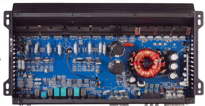
Klassische Class-AB-Technologie mit groß dimensioniertem Trafonetzteil

gerin nicht mehr konkurrenzfähig war, vielmehr ging es um Detailarbeit, die von Zeit zu Zeit nötig ist. Zum Beispiel, um die Endstufen optisch auf einen einheitlichen Stand zu bringen. Deshalb hat die R-150.2 jetzt auch Das Audio-System-Logo als quadratische Wechselplatte. Diese kann nicht nur gedreht werden, damit das Logo für den Betrachter nicht auf dem Kopf steht, im Zubehörprogramm finden sich auch beleuchtete