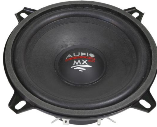
MXS 130 EVO