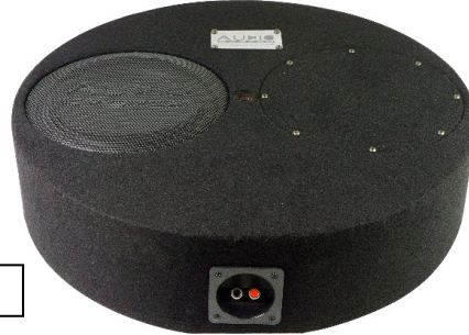
SUBFRAME R10 FLAT EVO 3