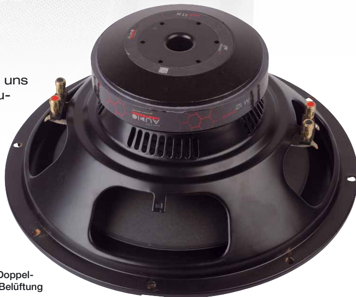
Gut gemachter Antrieb mit Doppelschwingspule und reichlich Belüftung

einen Ausschnitt für eine passive Anschlussdose. Unser Testkandidat ist der M 12-D4 BR Active 400 Evo2, und hinter diesem sperrigen Namen verbirgt sich der Zwölfzöller M 12 Evo2-D4 in einem Bassreflexgehäuse, das aktiv ist, und zwar mit der M-400.1 MD Endstufe. Diese ist natürlich auch einzeln erhältlich, womit