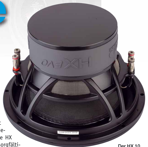
Der HX 10 Evo vertraut auf ein inneres Belüftungssystem, daher fehlt eine Polkernbohrung

Konstruktionsmerkmale der HX Evo eher auf der sauberen Seite, anstatt alles nach dem Motto je mehr, je lieber zu dimensionieren, kommen die HX mit wertiger Materialauswahl und sorgfältiger Konstruktion daher. Auch das größte Modell, der HX 12 Evo, verfügt „nur“ über eine Zweizollspule, die Magnetsysteme verzichten