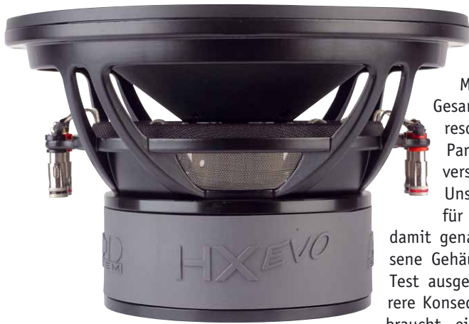
Bearbeitete Polplatten und ein Doppelferrit treiben die Zweizollschwingspule an