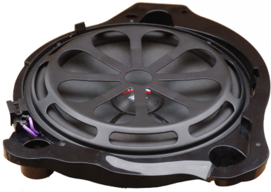
AX 08 MBL EVO