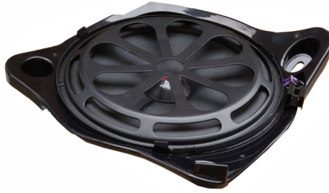
AX 08 MBR EVO