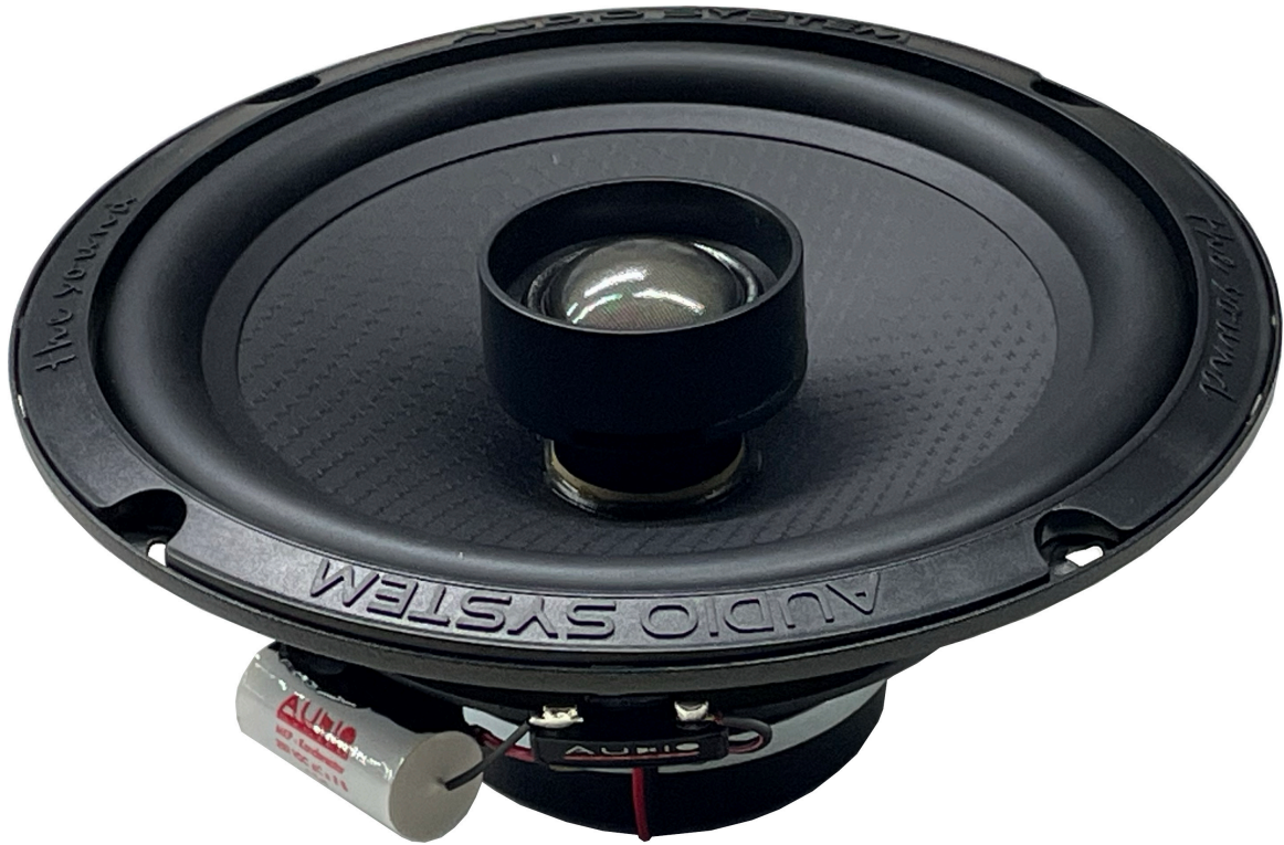
Beispiel / Example HXC 165 EVO3