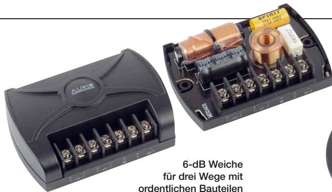
6-dB Weiche für drei Wege mit ordentlichen Bauteilen